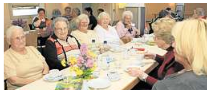
Der Club des Goldenen Alters trifft sich wieder am kommenden Montag um 14.30 Uhr in der Notkirche.

Männer auf der Suche nach der eigenen Spiritualität – Männer auf der Suche nach der eigenen Selbstwerdung. Wir sind in der Nacht unterwegs in einen neuen Tag hinein, schweigend und redend, hörend und staunend. Wir sind unterwegs von Gründonnerstagabend in den Morgen des Karfreitags hinein und hören auf die Leidensgeschichte Jesu, nehmen unser eigenes Leid mit, können es auch mit anderen Männern teilen – und strecken uns aus nach dem Neuen und Heilen, das uns entgegenkommt. Wir beginnen mit einem Abendessen (23 Uhr) zur Stärkung im Gemeindehaus der Michaelsgemeinde in Darmstadt, laufen in Richtung Rossdorf und Umgebung und kommen am frühen Morgen wieder nach Darmstadt zurück. Gegen 6.15 Uhr am Karfreitagmorgen erwartet uns ein Frühstück. Jede Stunde legen wir einen Halt ein, legen ein Kreuz aus hellen Steinen und feiern einen kleinen spirituellen Impuls. Wir freuen uns auf Dein Kommen und Mitmachen. Anmeldung: Andreas Schwöbel, Kirche & Co., Rheinstraße 31, Telefon 061 51 / 29 64 15, E-Mail: andreas.schwobel@kircheund-co.de.