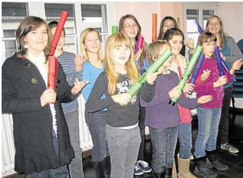
Der Jugendchor mit seinen Instrumenten.

Samstag, 5. März: 17.45 Uhr Beichtgelegenheit; 18.30 Uhr Vorabendmesse. Sonntag, 6. März: 10 Uhr Familiengottesdienst. Dienstag, 8. März: 18 Uhr Eucharistiefeyer (Altenheimkapelle). Mittwoch, 9. März: 8.15 Uhr Schülerwortgottesdienst mit Austeilung des Aschenkreuzes; 19 Uhr Eucharistiefeyer in der Kirche mit Austeilung des Aschenkreuzes. Donnerstag, 10. März: 16 Uhr Eucharistiefeyer mit Austeilung des Aschenkreuzes (Altenheimkapelle). Freitag, 11. März: 8.30 Uhr Aussetzung des Allerheiligsten (Altenheimkapelle); 9 Uhr Eucharistiefeyer (Altenheimkapelle); 18.30 Uhr Kreuzweg (Altenheimkapelle). Sonntag, 12. März: 17.45 Uhr Beichtgelegenheit; 18.30 Uhr Vor-