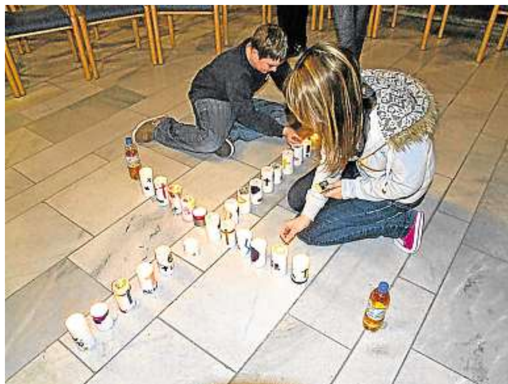
Zahlreiche Konfis und Jugendliche feiern die Osternacht.