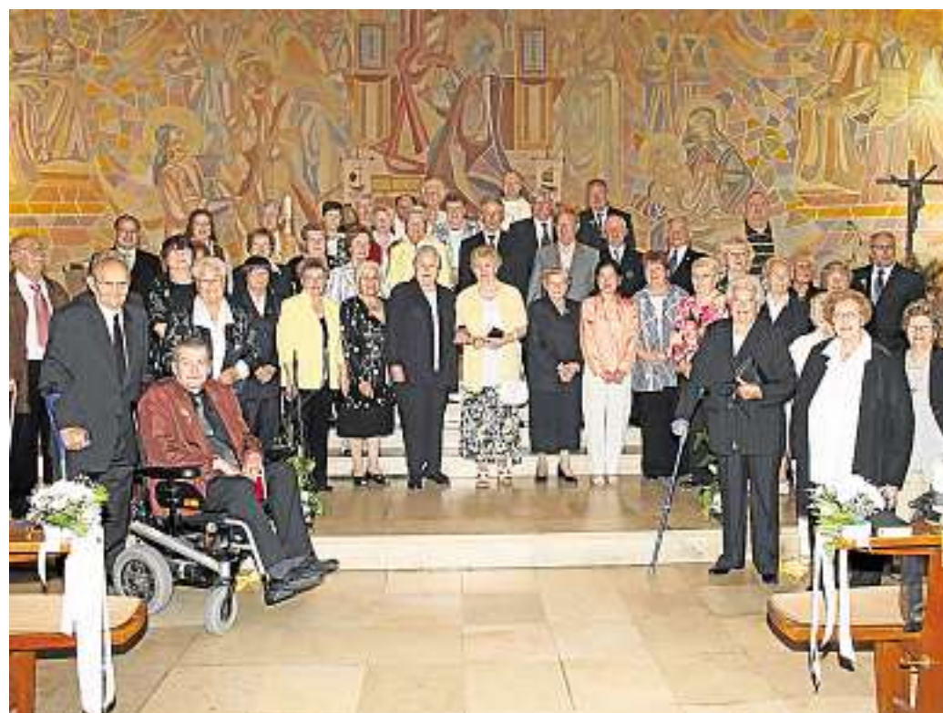
Gemeinsam feierten die Teilnehmer ihre Jubel-Kommunion.

Samstag, 21. Mai: 9.30 Uhr Konfi-Tag, Luther-Haus. Sonntag, 22. Mai: 9.30 Uhr Gebetskreis, Luther-Haus; 10 Uhr Gottesdienst mit Taufmöglichkeit, Pfarrer Kröger. Montag, 23. Mai: 18 Uhr Funktionsgymnastik, Luther-Haus. Mittwoch, 25. Mai: 14.30 Uhr Seniorennachmittag, Luther-Haus. Donnerstag, 26. Mai: 14.30 Uhr Kinderchor Piano; 15.30 Uhr Kinderchor Mezzoforte; 16.30 Uhr Kinderchor Fortissimo; 18.30 Uhr Kirchenchor; 20 Uhr Chor Mosaik, alle Chöre in der Römerstraße 94 (Notkirche). Freitag, 27. Mai: 15 Uhr Ökumenekreis, Mariä Verkündigung; 19 Uhr Jungbläser, Luther-Haus; 20 Uhr Posaunenchor, Luther-Haus.