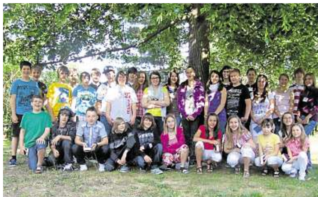
Die neuen Konfirmanden stellten sich vor.