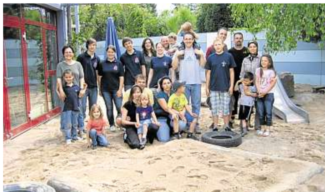
Fleißige Helferinnen und Helfer nach der ausgeführten Arbeit am Sandkasten.