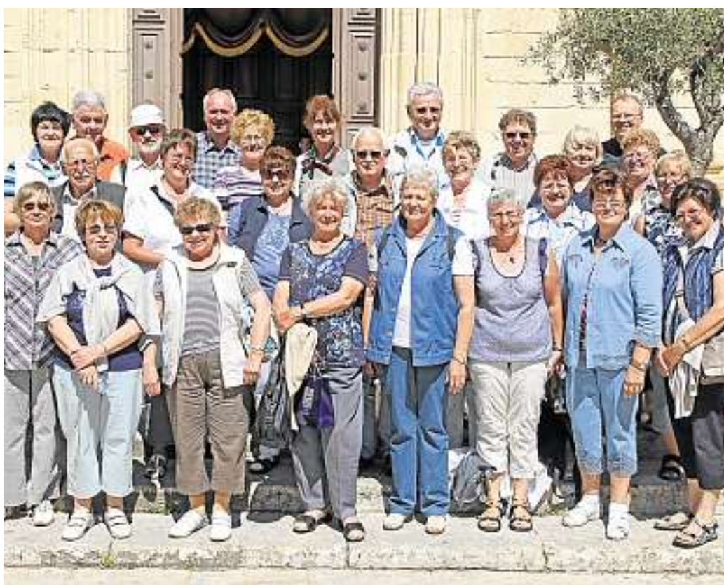
Die Teilnehmer der Pilgerfahrt erlebten eine ereignisreiche Zeit auf Malta auf den Spuren des Apostels Paulus.

Sonntag, 26. Juni: 9.30 Uhr Gottesdienst mit Abendmahl. Mittwoch, 29. Juni: 9 Uhr Tagesausflug der Gemeinde (Fahrt an die Weinstraße und die südliche Pfalz). Donnerstag, 30. Juni: 19 Uhr Frauentreff. Freitag, 1. Juli: 19.30 Uhr Posaunenchor.