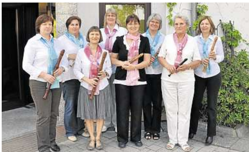
Die 1996 gegründete Gruppe „Allegro“ mit ihren Instrumenten.