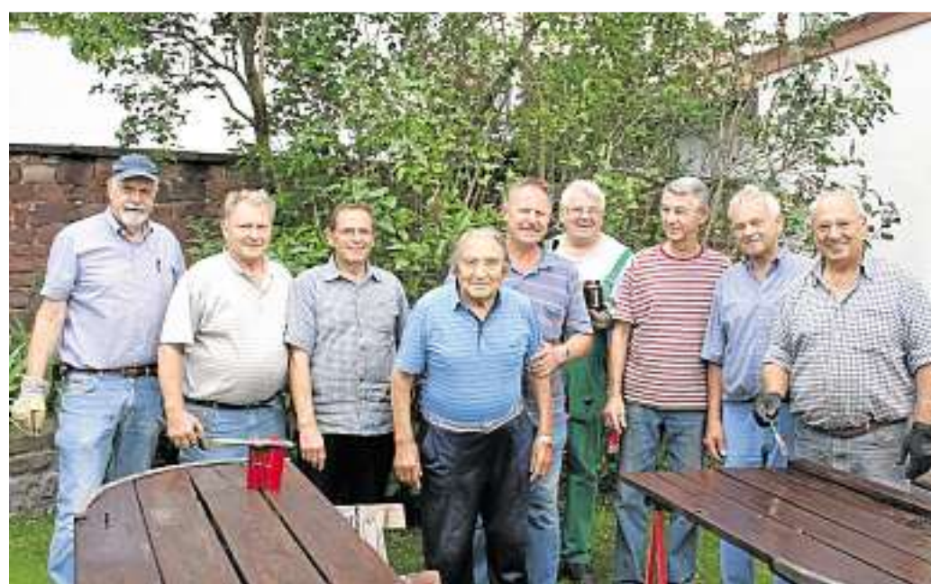
Während der Sommerferien werden die Gemeindeengel besonders aktiv.

Während in der Lukasgemeinde alle Gruppen und Krei-