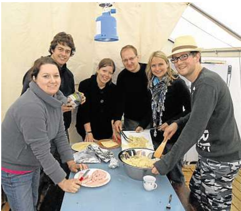
Dank des Küchenteams muss im Zeltlager keiner Hunger leiden.