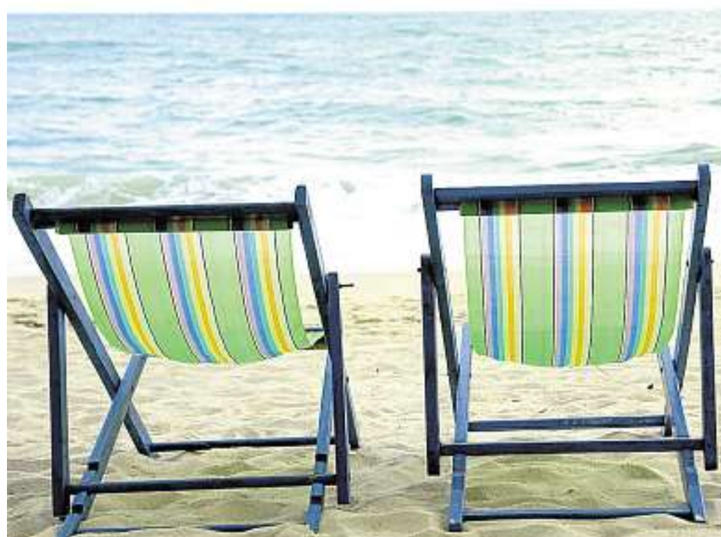
Liegestühle am Meer laden zum Entspannen ein.