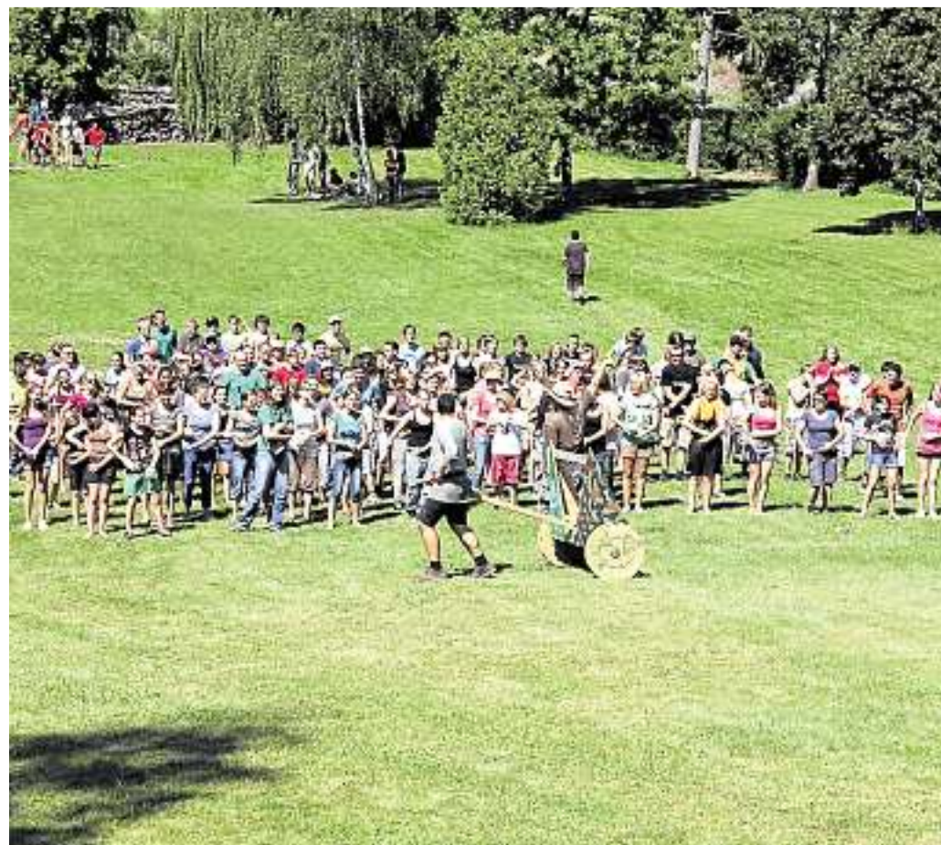
Das Motto des Sommerlagers war „Troja: das vergessene Reich“.

haltlichen Bedeutung im Taufgottesdienst am morgigen Sonntag, 14. August, um 10 Uhr vorgestellt. Danach stehen die Schmuckstücke erstmals zum Verkauf bereit. Der Künstler wird persönlich anwesend sein.