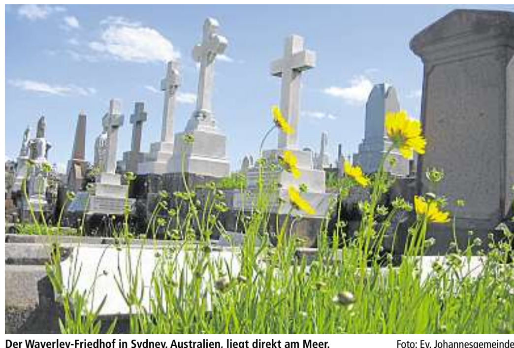
Der Waverley-Friedhof in Sydney, Australien, liegt direkt am Meer.

Sonntag, 21. August: 9.30 Uhr Gottesdienst im Schafstall auf der Wiese in Lampertheim, Wehrzollhaus (Mitwirkung: Kirchenchor). Montag, 22. August: 15 Uhr Kindergruppe, sechs bis zehn Jahre. Dienstag, 23. August: 15.30 Uhr Konfirmandenunterricht; 18 Uhr Grillabend der Konfirmanden und des Kirchenvorstands; 20 Uhr Kirchenchor. Mittwoch, 24. August: 15 Uhr Frauenhilfe; 19 Uhr Abendandacht; 19.30 Uhr Kirchenvorstandssitzung. Freitag, 26. August: 9.30 Uhr Krabbelgruppe; 19.30 Uhr Posaunenchor.