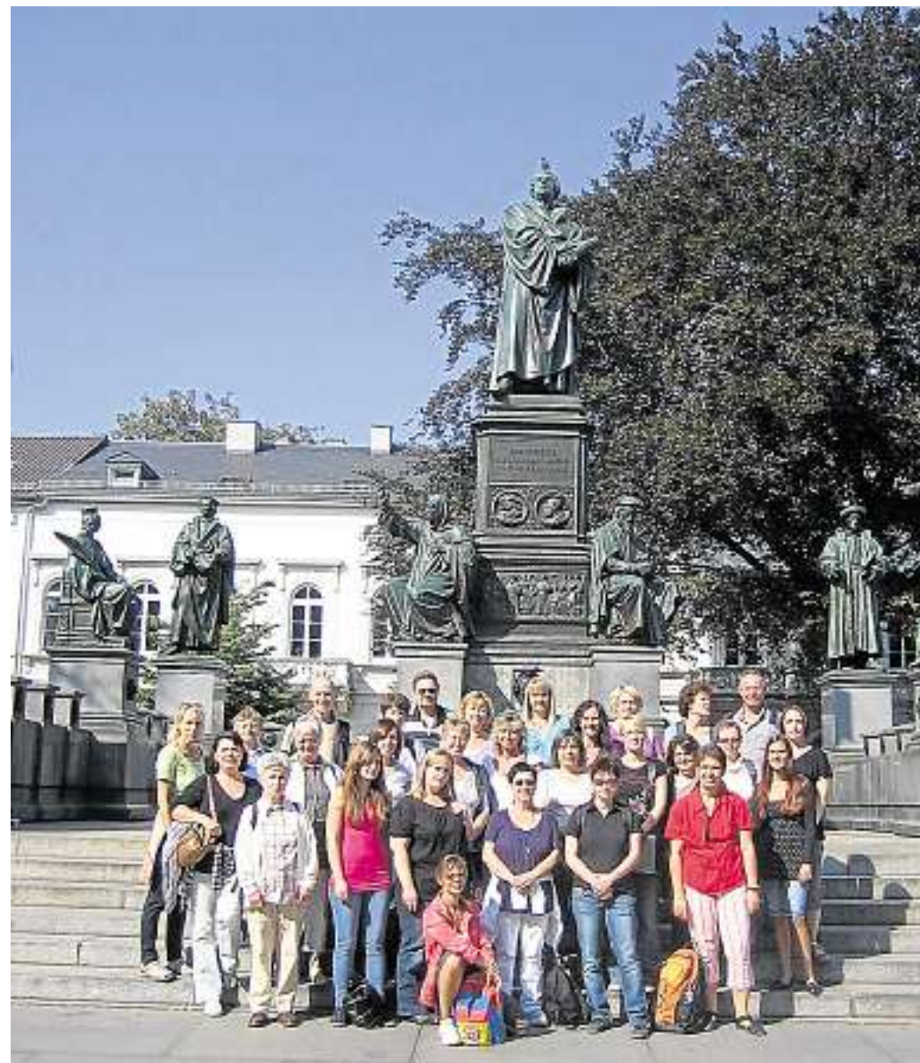
Viel Spaß hatten die Teilnehmer beim Betriebsausflug in Worms.